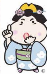
川崎町キャラクター 小梅ちゃん ©