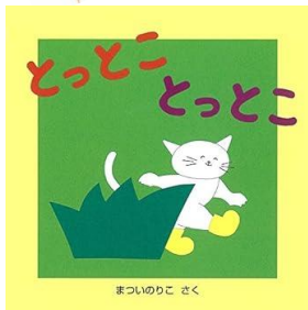
「とつとこ とつとこ」 まっいのりこ/作

*上記の2冊をすでにお持ちの方は、下記のえほんの中から交換することができます。 交換をご希望される方は、川崎町立図書館までご連絡をお願いします。 (えほんは無くなり次第終了です。ご了承ください)