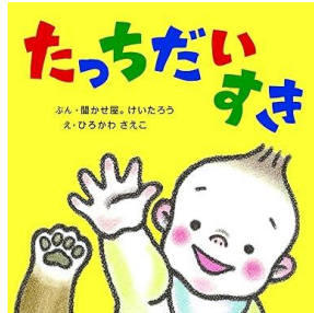
「たっちだいすき」 間かせ屋。けいたろう/文 ひろかわさえこ/絵