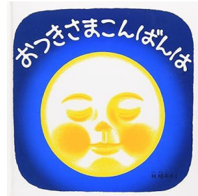
「おつきさまこんばんは」 林 明子/作