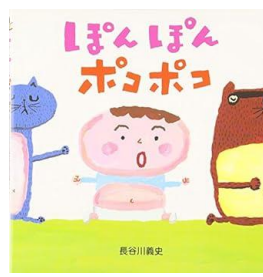
「ぽんぽんポコポコ」 長谷川義史/作