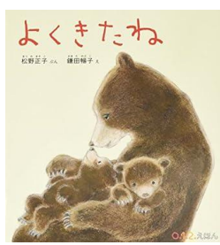
「よくきたね」 松野正子/作 鎌田暢子/絵