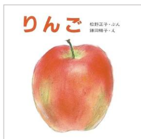
「りんご」 松野正子/文 鎌田暢子/絵